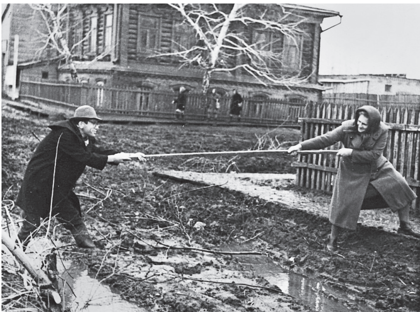
Фото для очередного фельетона