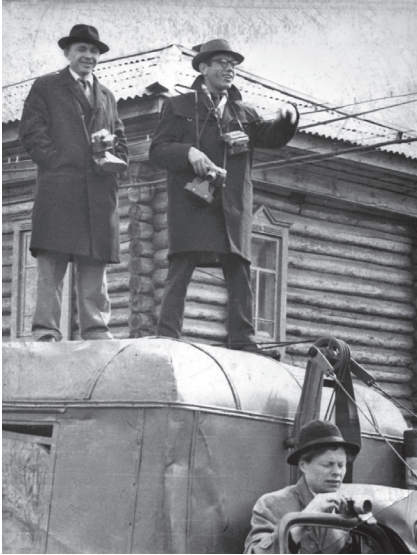
Корреспонденты на автобусе