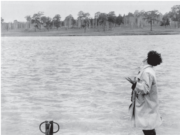
Песня посвящена Загородному Бору