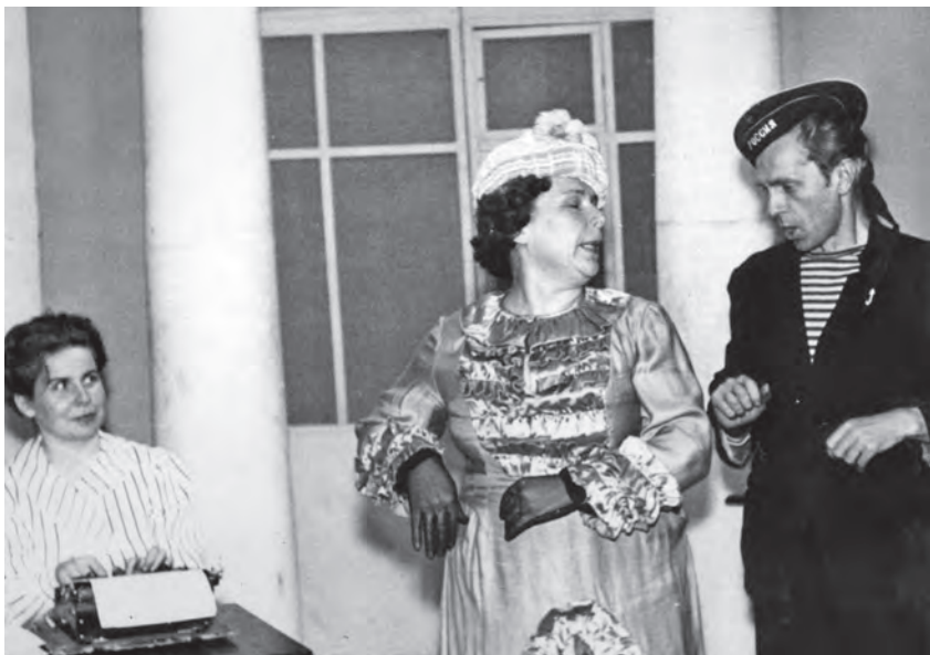
Сцена из спектакля «Любовь Яровая»

гогического училища. По решению художественного совета при театре в 1968–1969 годах организовали молодёжную драматическую студию. Необходимость ее создания была вызвана большим притоком желающих прийти на сцену. В студии изучались основные элементы актерского мастерства, проводились практические занятия, беседы о законах сценического искусства. Занятия в студии велись по специально разработанной программе. Курс был рассчитан на два года, четыре семестра. Позже были новые режиссеры и актеры, интересные спектакли. К сожалению, нынче театра в Болотном нет, но мы надеемся, что наступят времена новой театральной весны.