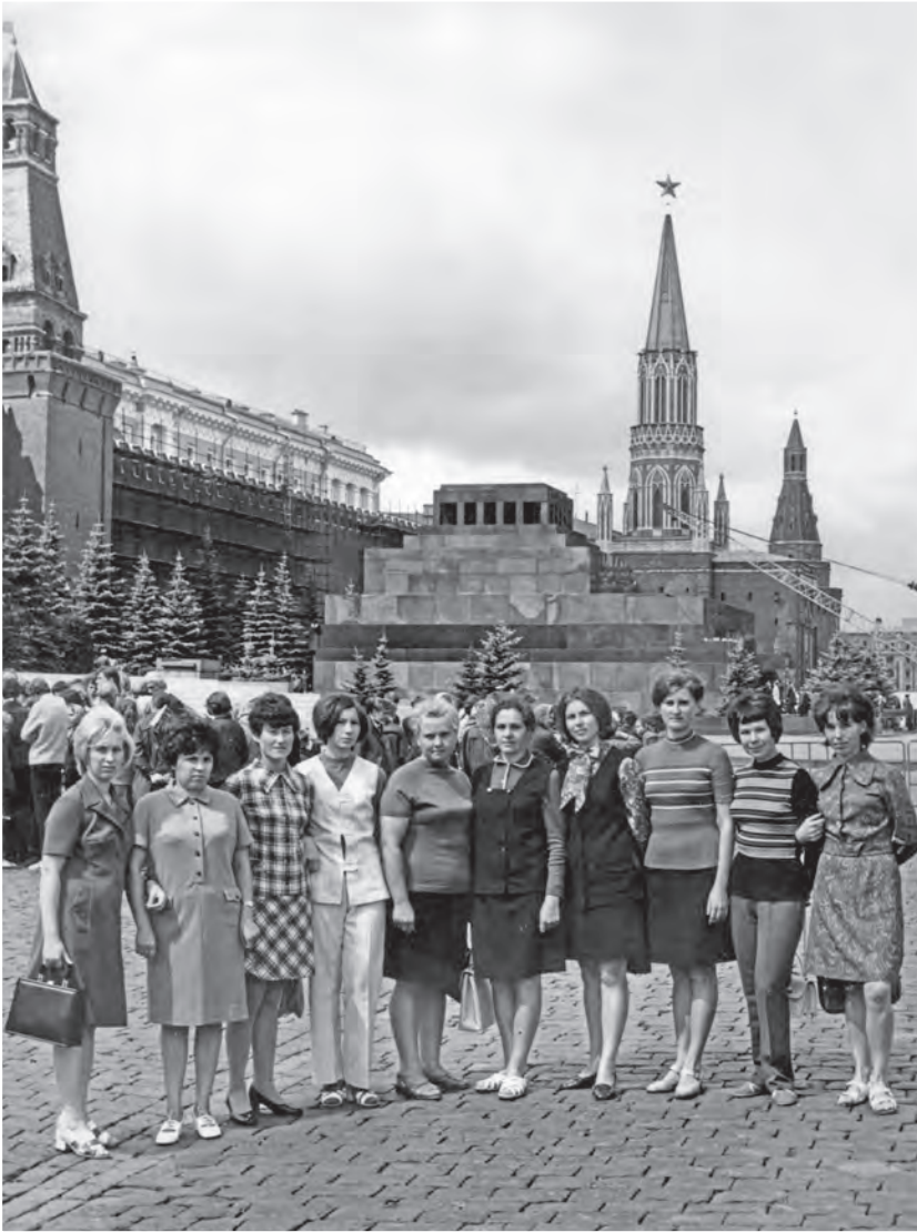
Учеба во МГИК