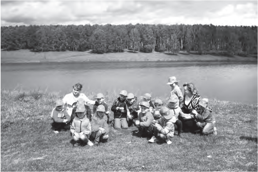
Ребята из детского сада «Малышок» на берегу Водокачки

вораживающей красотой зимнего леса, медленно скользят по лыжне.