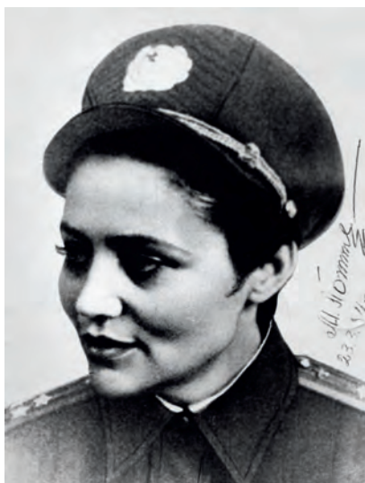
Летчица-испытатель Марина Попович

А одноклассники отмечали ее упорство в достижении поставленной цели. Особенно их удивляло, как девочка боролась со своим низким ростом. Когда в свободную минуту другие ребяташки играли, Марина висела вниз головой, зацепившись ногами за перекладину турника.