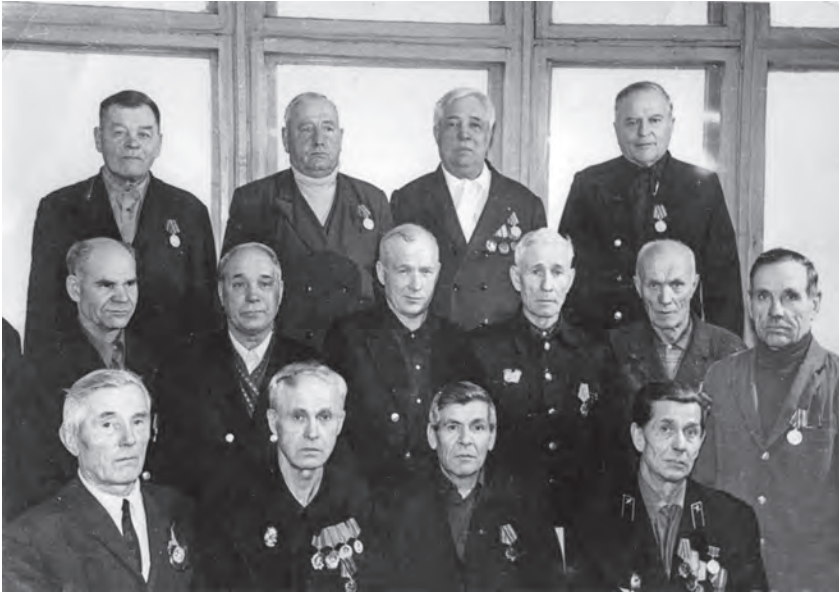
Железнодорожники станции Болотная — ветераны Великой Отечественной войны и труда