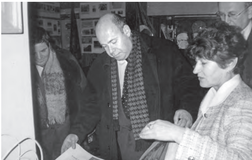
Тамара Николаевна знакомит министра культуры М. Е. Швыдкого с музеем Болотнинского района. Май 2008 года