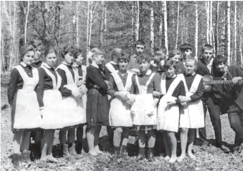
Выпускной. 1966 год