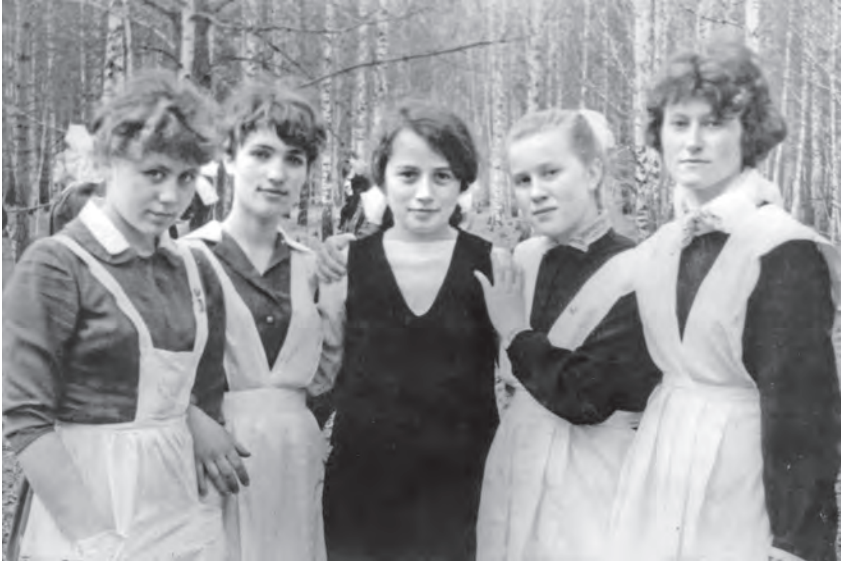
Десятый класс. 1966 год