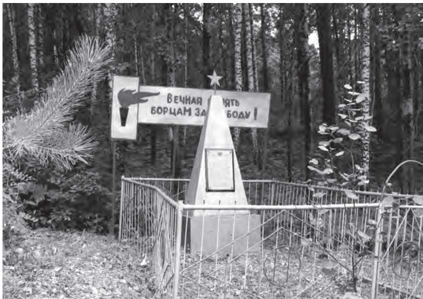
Памятник в Ояше