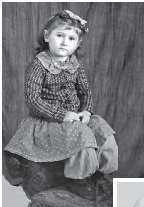
Мне 6 лет. Это моя первая фотография