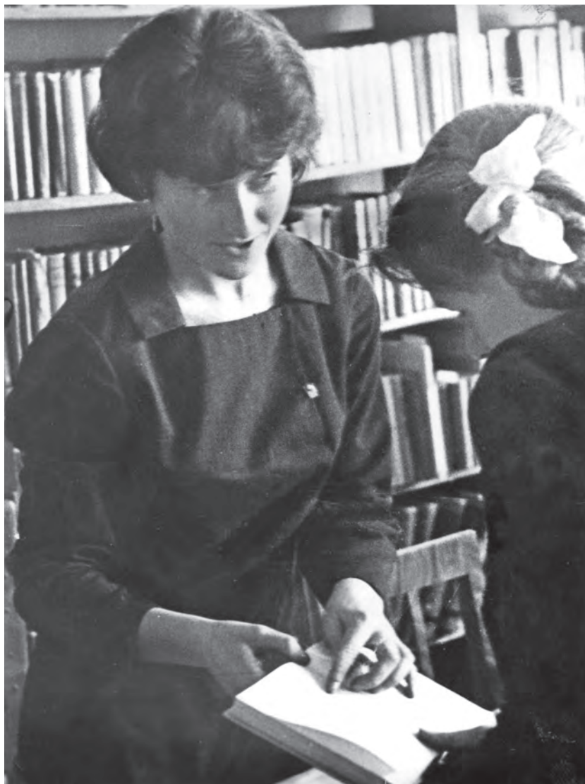
Читальный зал Болотнинской районной библиотеки