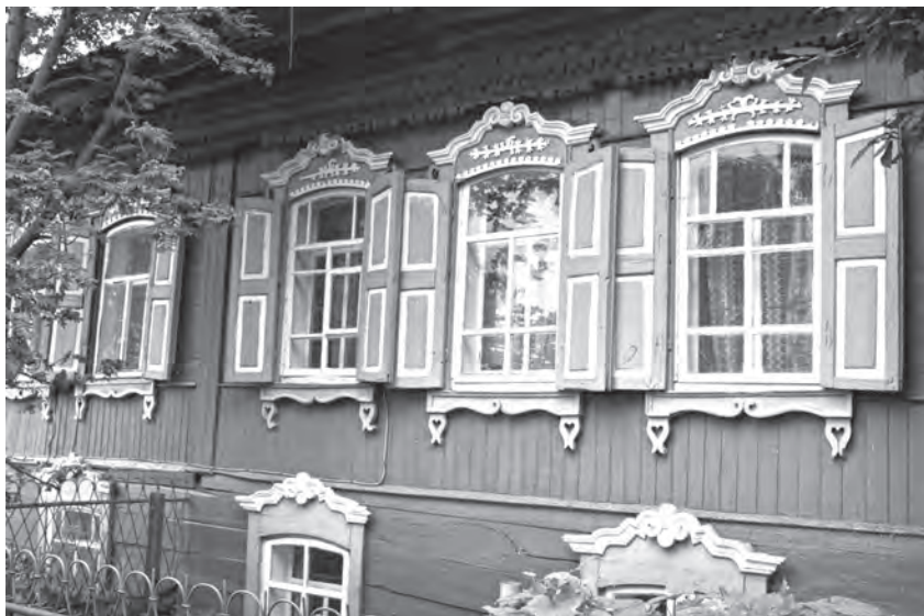
Дом ямщика Голишева

ресом заглядывали в комнату инженера, но, не видя ничего интересного, со смехом убегали к себе в подвал. Дом понимал, что инженер делал очень важную и нужную работу, но какую — не мог понять.