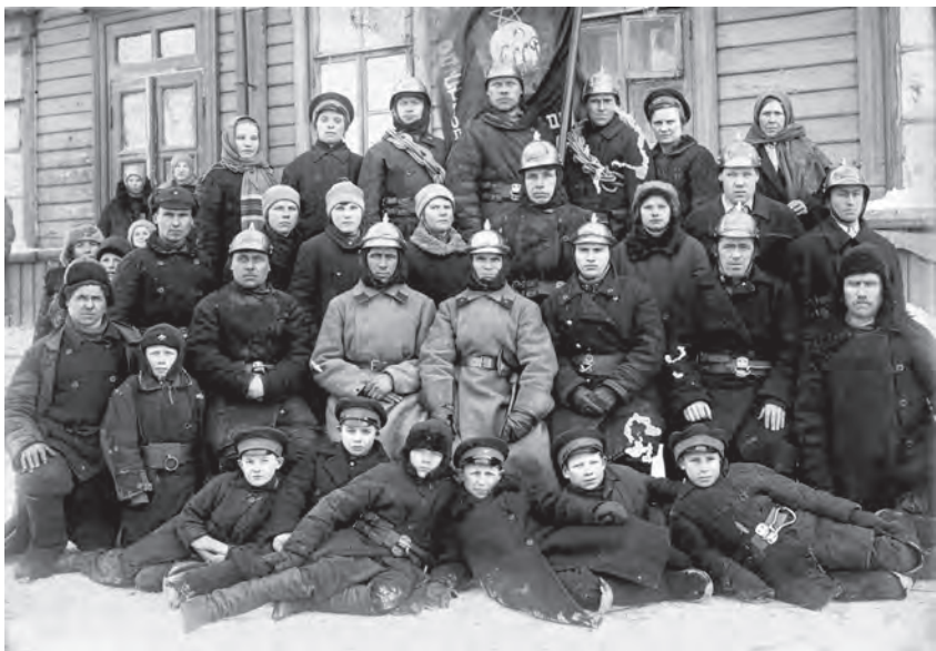
Первая пожарная дружина Болотного. 1920-е годы