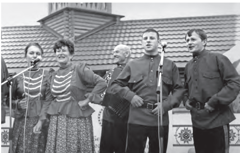
Концерт в Новосибирске