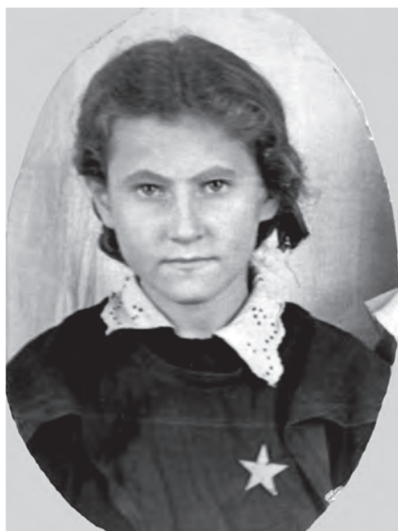
Я в 3-м классе средней школы №4