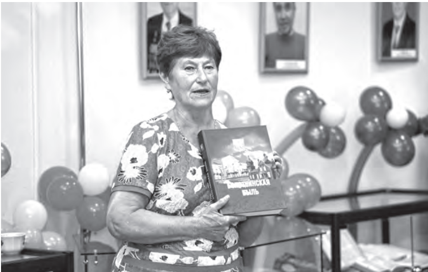
Презентация книги «Болотнинская быль»